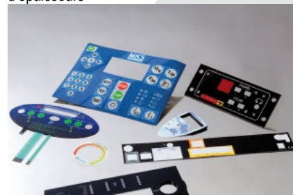
Faces-avant / Lexan

Les capacités de découpe de nos équipements garantissent un degré de précision pouvant atteindre \pm 0.1 mm, et ce sur un large éventail d'épaisseurs