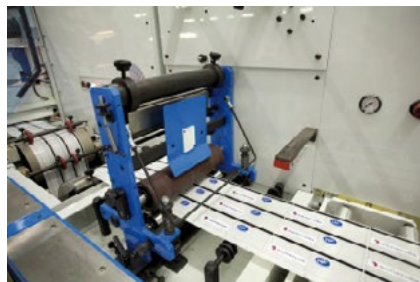
Fabricant étiquettes techniques

Acteurs du secteur électronique, SUPRATEC JMD met à votre disposition des offres et solutions pour vous. Fabricant, sous-traitant, câbleur, intégrateur, maintenancier, venez défier la créativité d'un fabricant de plus de 40 ans d'expérience en marquage industriel.