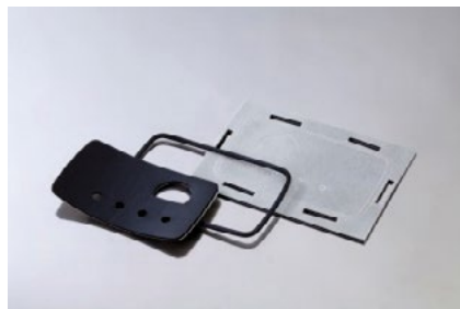
Pièce fonctionnelle découpée

De l'étiquette vierge, PET, blanc, aluminium, PP, PE au marquage le plus complexe, nous réalisons l'étiquette technique sur-mesure découpée au format pour l'identification de votre produit. Notre savoir-faire en complexage de matières permet de concevoir la solution à façon répondant à vos contraintes exprimées.